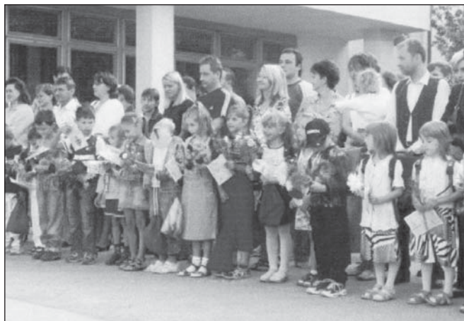
Prvňáčci s rodiči plní nových dojmů a očekávání.

❖ 9. r. - seminář z ČJ a M (pro žáky se studijními předpokla-