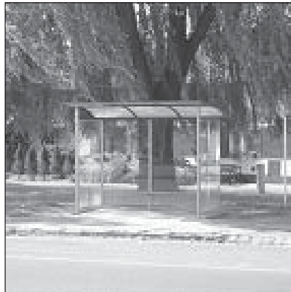
... u hřebčince