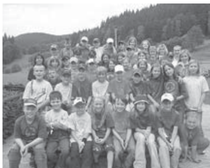
Společná fotografie před odjezdem domů.

Pro děti jsme připravili spoustu her s tajemnými názvy k danému tématu tábora. Děti se na 11 dní staly dobrodruhy, kteří pátrali po různých záhadách a archeologických památkách, jako byl například Faraónův pásek, Sošky Xapatan, Diamant zkázy a spousta