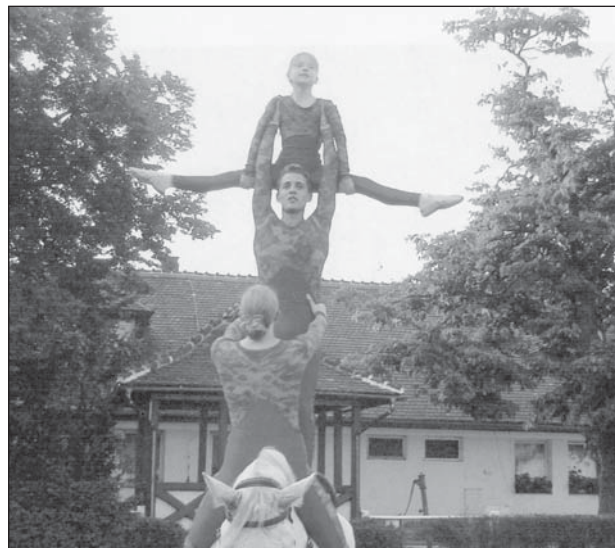
Ukázka sestavy - tlum. skupina - několikánásobní mistři ČR na koni Farmon.