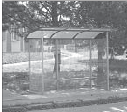
... ul. Dr. Horníčka