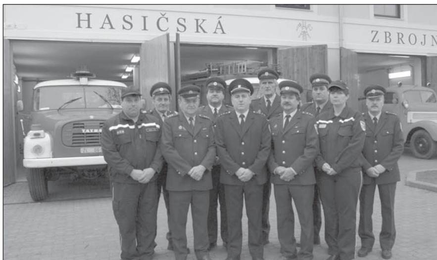
Členové výboru a funkcionáři SDH v roce 2005.