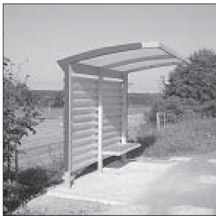
... na Skalách